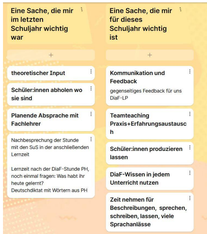
Grafik 1: Auszug aus einem padlet (Austausch im Team)

Seit dem 2. Projektjahr werden die im Unterricht erprobten Materialien und Aufgabenstellungen in den Workshops präsentiert, gemeinsam nachbesprochen und reflektiert.